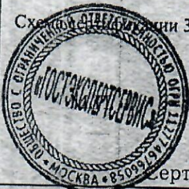
Схема ответственности 3.